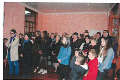
Un public intéressé a participé à l'inauguration des nouveaux locaux.