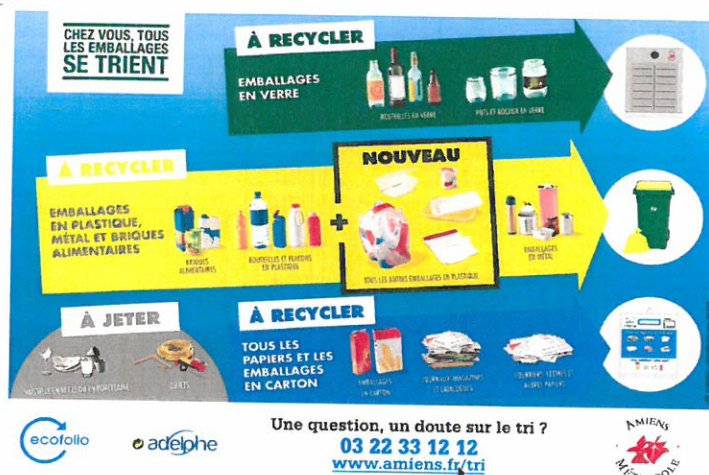
Schéma récapitulatif des déchets

Une question, un doute sur le tri ? 03 22 33 12 12 / www.amiens.fr/tri